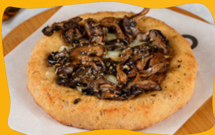
MIX DO COGUMELOS - SHITAKI COM SHIMEJI

Muçarela de búfala ou lacfree, alho assado com azeite, alho poró fatiado, e orégano para finalizar.