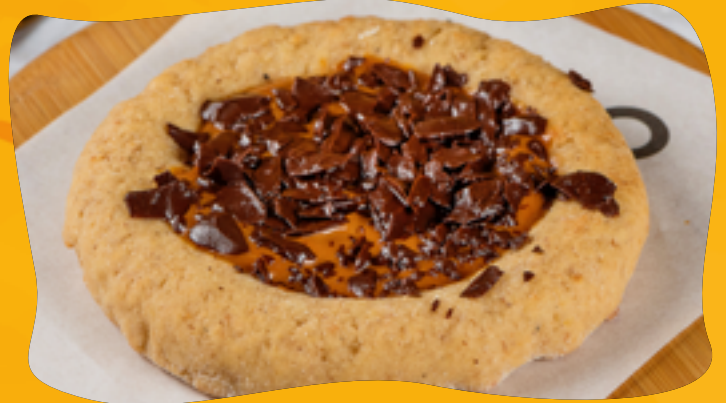
MILK CANDY WITH CHOCOLATE R$ 11,90

Chocolate 70% cocoa without sugar, without lactose, and vegan. And for a final touch of flavor, chocolate shavings.