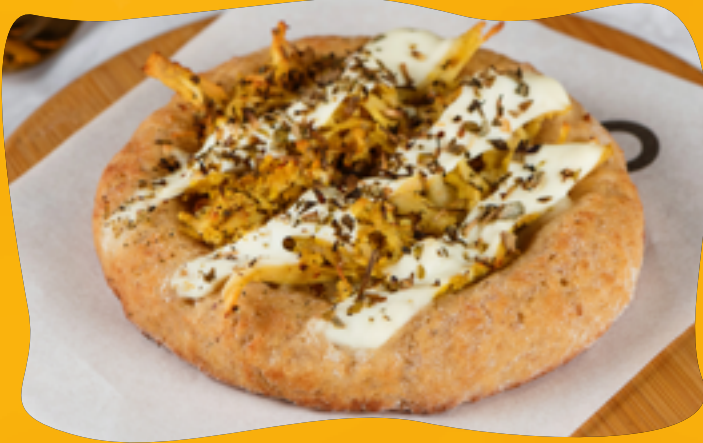
CHICKEN WITH RICOTTA CREAM