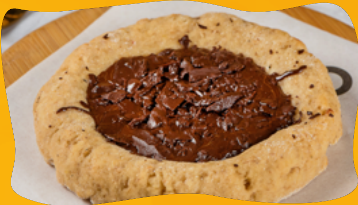
CHOCOLATE 70% CACAU R$ 11,90

Muçarela de búfala ou lacfree, docinho de banana 100% natural, sem conservantes e sem açúcar - adoçado com eritritol, rodela de banana polvilhada com canela e açúcar de coco