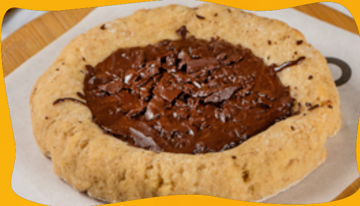
CHOCOLATE 70% COCOA R$ 11,90

Buffalo or lactose-free mozzarella, 100% natural banana candy, preservative-free and sugar-free - sweetened with erythritol, banana slices sprinkled with cinnamon and coconut sugar