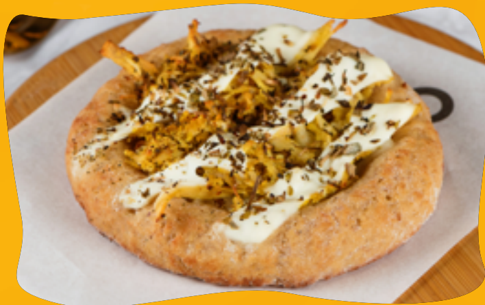
FRANGO COM CREME DE RICOTA