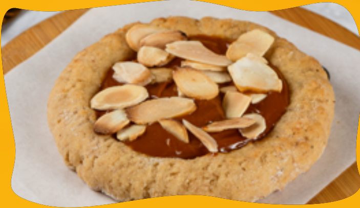
DULCE DE LECHE WITH LAMINATED ALMONDS R$ 11,90

Dulce de leche, sugar-free, zero lactose, finished with toasted laminated almonds, to make them very crunchy.