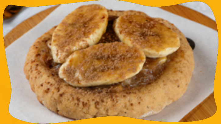
BANANA WITH CINNAMON R$ 11,90

Dulce de leche, sugar-free, zero lactose, finished with toasted laminated almonds, to make them very crunchy.