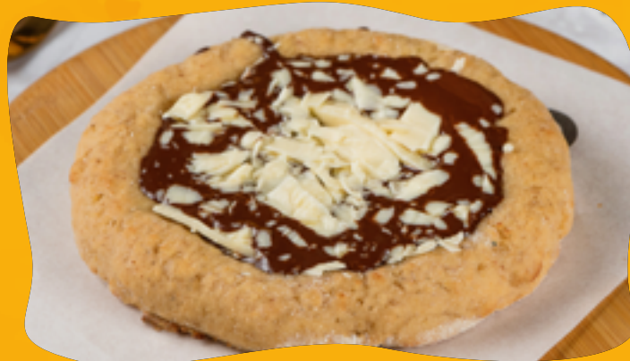
CHOCOLATE 70% WITH WHITE CHOCOLATE R$ 11,90

Dulce de leche, sugar-free, zero lactose, finished with chocolate to make it even more delicious.