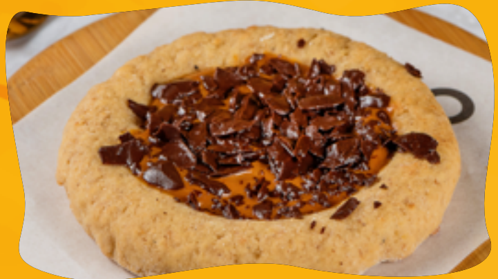
DOCE DE LEITE COM CHOCOLATE R$ 11,90

Chocolate 70% cacau sem açúcar, sem lactose, e vegano. E para um toque final no sabor, raspas de chocolate.