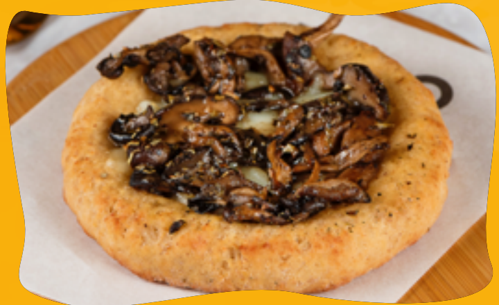
MUSHROOM MIX - SHITAKI WITH SHIMEJI

Buffalo or lactose-free mozzarella, roasted garlic with olive oil, sliced leek, and oregano to finish.