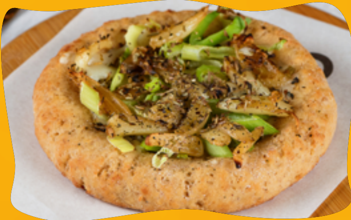
ROASTED GARLIC WITH GARLIC

Buffalo or lactose-free mozzarella, confit tomato seasoned with natural spices and oregano to finish.